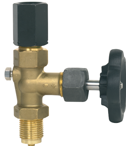
Запорный вентиль по DIN 16270, регулирующая гайка с левой-правой резьбой / наружная резьба G 1/2, PN 250

Версия запорного вентиля формы А поставляется с накидной гайкой с левой/правой резьбой, а формы В - с валом для монтажного кронштейна, со штуцером и накидной гайкой. Запорные вентили с тестовым присоединением предназначены для одновременной установки на трубопроводе манометра для измерения рабочего давления и образцового средства измерения давления. В запорных вентилях по DIN 16271 резьбовое поворотное присоединение герметизируется уплотнительным кольцом типа "линза" и устанавливаемой сверху резьбовой крышкой; в вентилях по DIN 16272 резьбовое поворотное присоединение отдельно изолируется дополнительным штоком. Запорные вентили не содержат силикон.