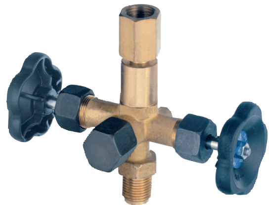
Запорный вентиль с отдельно отсекаемым тестовым присоединением по DIN 16272, накидная гайка с левой/правой резьбой/ наружная резьба G 1/2, с резьбовым поворотным присоединением M20 x 1,5, PN 400